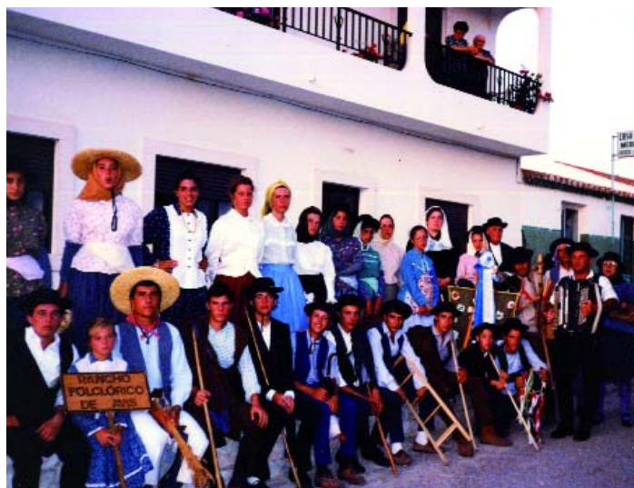
Há mais de 15 anos, numa deslocação ao Algarve

Não tem sido fácil garantir a continuidade. Os mais velhos dizem que os seus afazeres não lhes deixam disponibilidade para tal, e os mais novos, partem cedo para fora do concelho, por força dos estudos ou da procura de emprego.