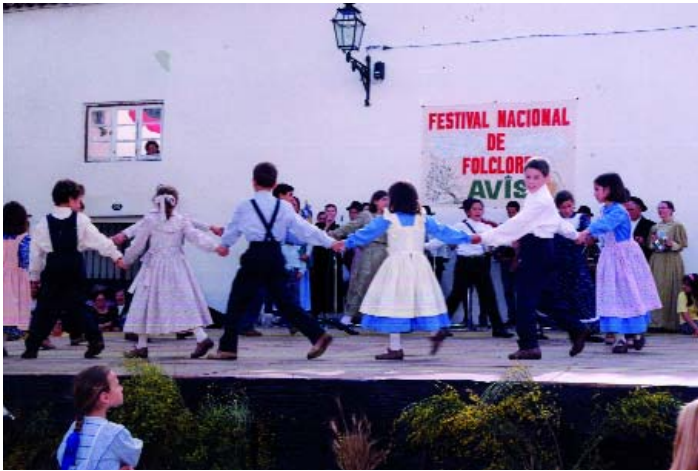
O Rancho Infantil tem garantido a continuidade