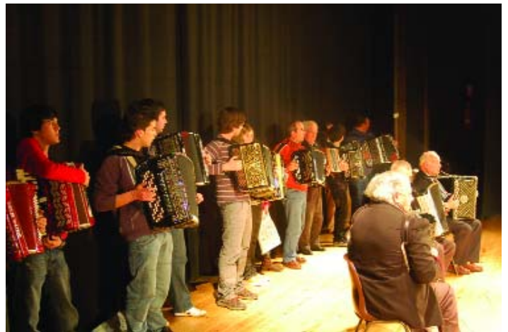
Encontro de Gerações

Dessa época, nada se salvou, por nada ter ficado escrito nem documentado, coisa que com o actual Rancho não se corre o risco que venha a acontecer. Primeiro porque os trajes, as músicas, as letras e as coreografias estão devidamente documentadas, e, depois, nada leva a crer que o Rancho Folclórico de Avis não dure, pelo menos, mais 25 anos.