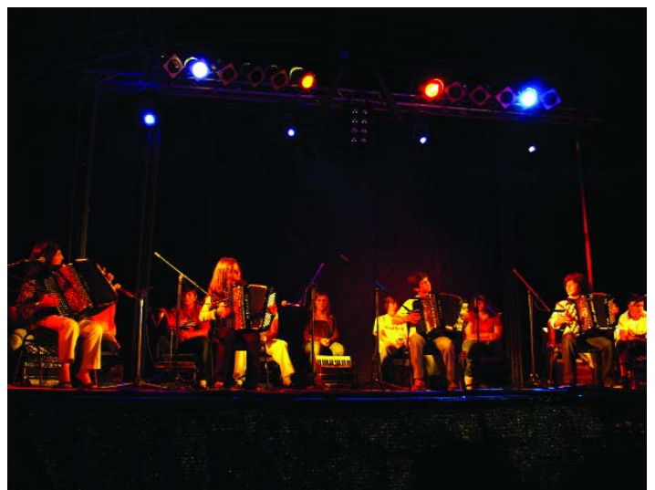
Alunos da Escola durante uma das suas apresentações