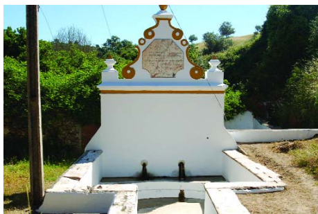
A Fonte Nova vai ser restaurada