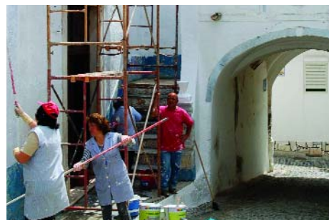
e a Igreja do Senhor Morto pintada