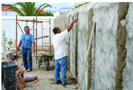
O muro do cemitério foi reforçado...