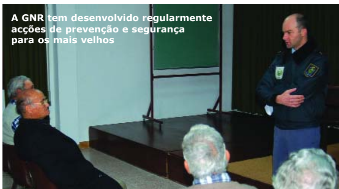
A GNR tem desenvolvido regularmente acções de prevenção e segurança para os mais velhos

A outro nível, e em conjunto com o Município e a GNR local, ir-se-à proceder à colocação de nova sinalização automóvel na área da freguesia que se encontra fora do Centro Histórico. Este trabalho é realizado pela Junta por delegação de competências da Câmara Municipal de Avis.