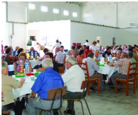
Aspecto do almoço