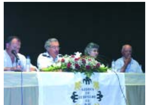
Jogos Florais de Avis / ACA