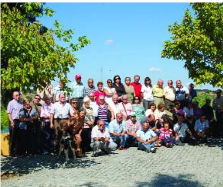
A habitual foto de família

No final o contentamento era generalizado e a vontade era de repetir a experiência com outras terras e outros amigos.