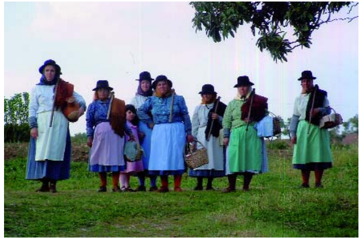
O rigor etnográfico dos trajes é uma preocupação sempre presente