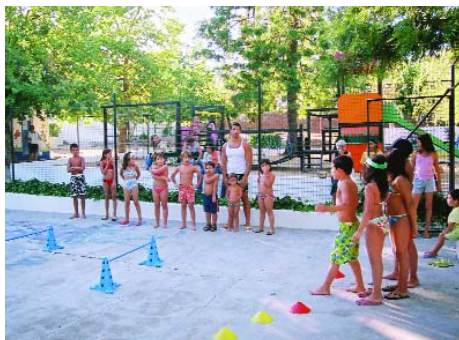
O Parque Infantil vai ter melhoramentos

No que diz respeito à informação das nossas actividades e promoção da nossa terra a autarquia, para além deste boletim, continuará a dar toda a atenção ao site e pretende lançar novas iniciativas de forma a captar investimento com vista à fixação da população da Freguesia. Neste sentido proporcionámos a realização, em Outubro de 2008, no salão da Junta de Freguesia de um encontro de quadros da Associação Nacional de Direito ao Crédito - sobre microcrédito e microempreendedorismo - e, na próxima Primavera, acolheremos o 1º Troféu de Aerodelismo de Avis, um