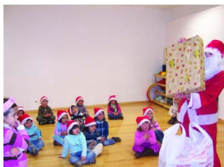
Distribuição de presentes no Natal